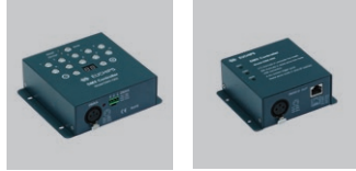
DMX Kontrol Ünitesi

İç ve dış aydınlatmada yere gömme olarak kullanılabilen yüksek verimli lineer armatürlerdir. Paslanmaz çelikten çerçevesi, yüksek dayanımlı ısı işlem görmüş camı, ısıyı kolayca transfer edebilen korozyona dayanıklı alüminyum gövde yapısı sayesinde uzun kullanım ömrüne sahiptir. Armatürde üretilen ışığın renk sıcaklığı farklı LED'ler aracılığıyla sağlanabilmektedir. DMX kontrol ünitesine bağlanarak RGB olarak kullanılabilir.